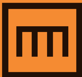
Amigos del Bellas Artes